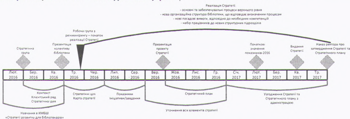
Схема 1. Основні етапи розроблення та впровадження стратегії розвитку Бібліотеки КПІ

Загальну часову шкалу основних етапів розроблення та впровадження стратегії розвитку Бібліотеки КПІ представлено на схемі 1.