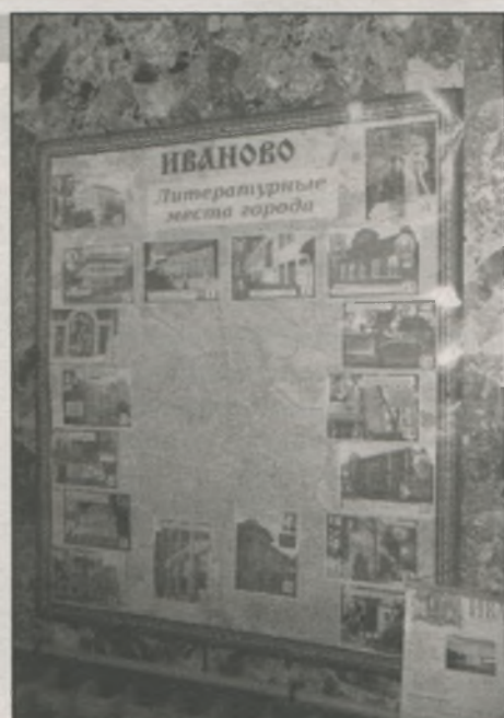
● «Литературная карта города»

В частности, в Ивановской ОБДЮ отдел «Краеведение» оформлен видами города, кото-