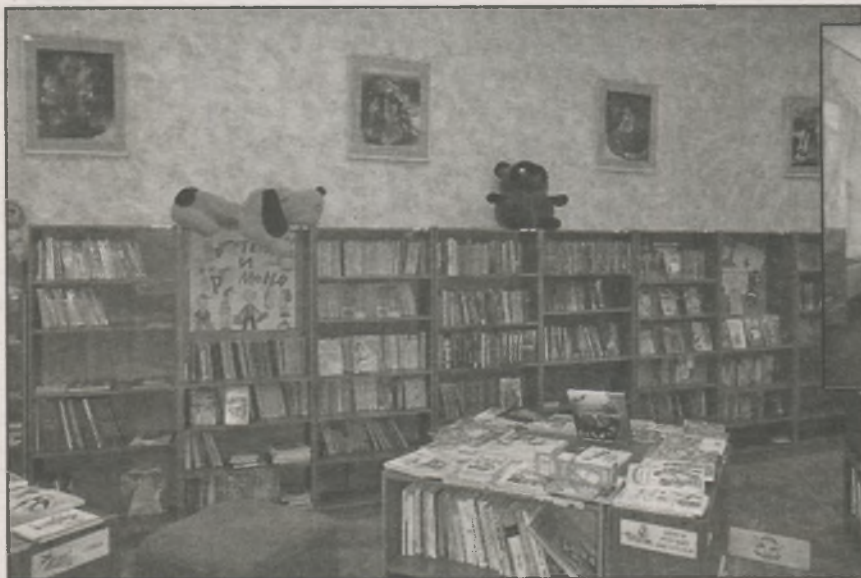
● Репродукции иллюстраций к сказкам «Морозко», «Маша и Медведь» в отделе «Детство». Автор Н. Фёдорова

Первоначально мы не стали подписывать постеры, а предложили нашим читателям викторину «Где эта улица? Где этот дом?» (вопросы были напечатаны в «Ивановской газете» и в рекламных буклетах, которые раздавались нашим посетителям). Предложили им самим ответить, что они видят на снимках, и написать названия улиц и зданий.