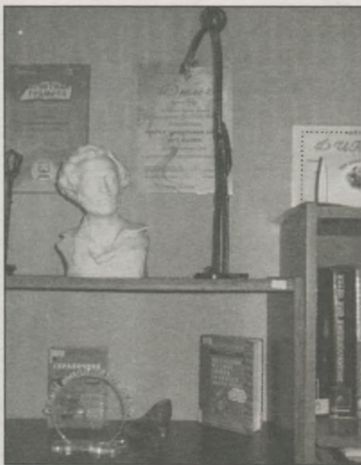
● Работы из металла в Медиацентре (читальный зал «Тинэйджер»). Автор А. Волков

Окна библиотеки были устроены с подсветкой, так как в них было решено вставлять листы с информацией о том, что будет происходить в отделе в определённый день и час. Маленькие импровизированные балкончики (которых на самом деле нет) были сделаны в целях размещения в них различных рекламных буклетов и приглашений на мероприятия. Под каждым окошечком — название отдела, этаж и номер кабинета, в котором он размещается. На крыше дома студенты выполнили силуэт сидящего чёрного