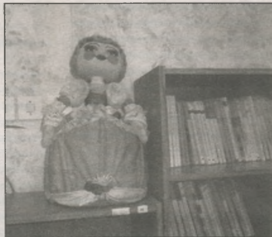
● Куклы в интерьере отдела «Детство» («Клоун», «Дракоша», «Принцесса»). Автор Н. Демьяненко