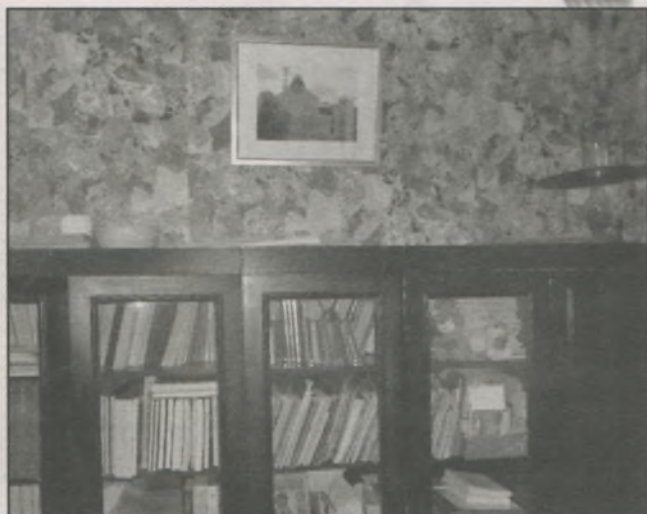
● «Взгляд из окна»: постеры в отделе краеведения

библиотека, а именно Ивановская (Ярославская, Тамбовская...) областная библиотека для детей и юношества...»