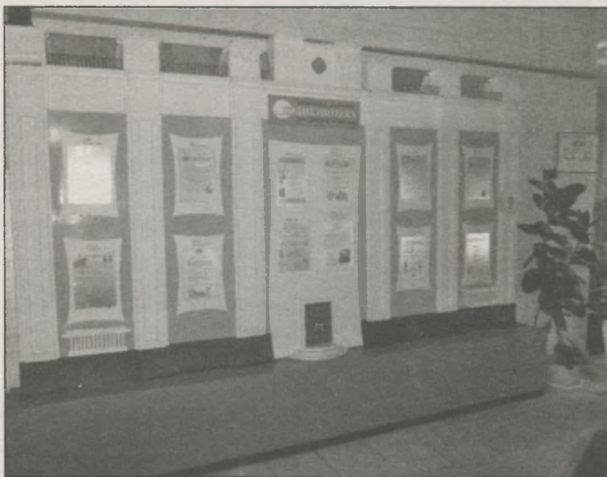
● «Дом на Крутицкой» — информационный стенд в холле ОБД

Продолжение материала будет посвящено различным формам расстановки и представления фондов в открытом доступе для читателей разных возрастов и системе ориентирования в них.