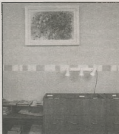
● Картины «Птица Сирин» и «Природа. Рог изобилия» в читальном зале «Юность». Автор Н. Демьяненко

Когда итоги викторины были подведены, а победители награждены, в отделе появились соответствующие надписи к постерам. Многие посетители до сих пор удивляются, что не замечали какие-то городские сооружения, которые видны из окон библиотеки,