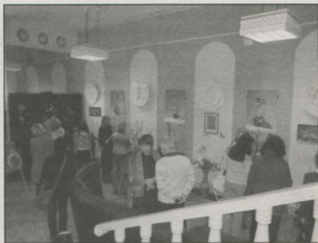
● Защита курсовых работ студентов факультетов «Дизайн и культурный сервис» и «Текстильный дизайн» Ивановской государственной текстильной академии