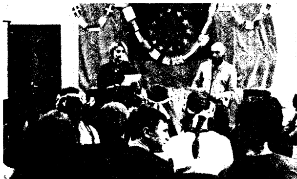
Відзначення Дня Європи

9–10-й годині вечора на батьківське запитання «Ти де?», їхні чада відповідали: «Я в бібліотеці», вгаючи дослужив у ступор. А скільки матусь і татусів спочатку вважали, що це не молодіжний центр при бібліотеці, а якась зловісна секта!.. Деякі приходили до мене знайомитися і були ще більш здивовані, коли бачили директорку, котра грала разом із мо-